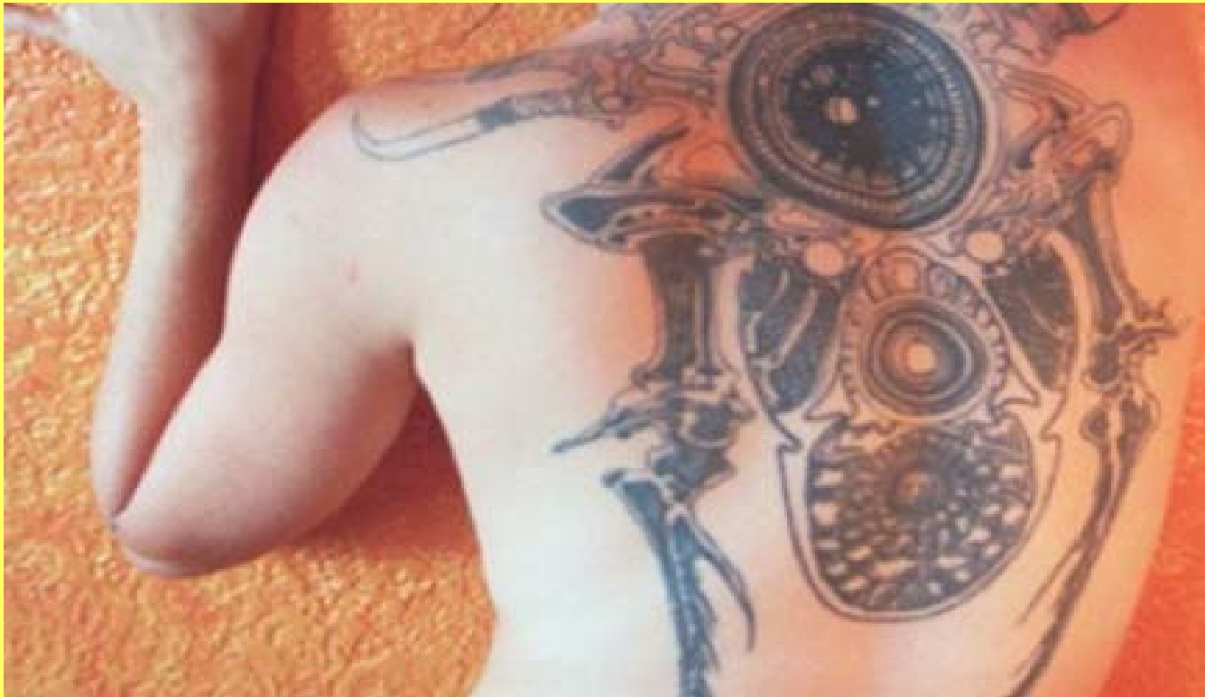
Juin 2009